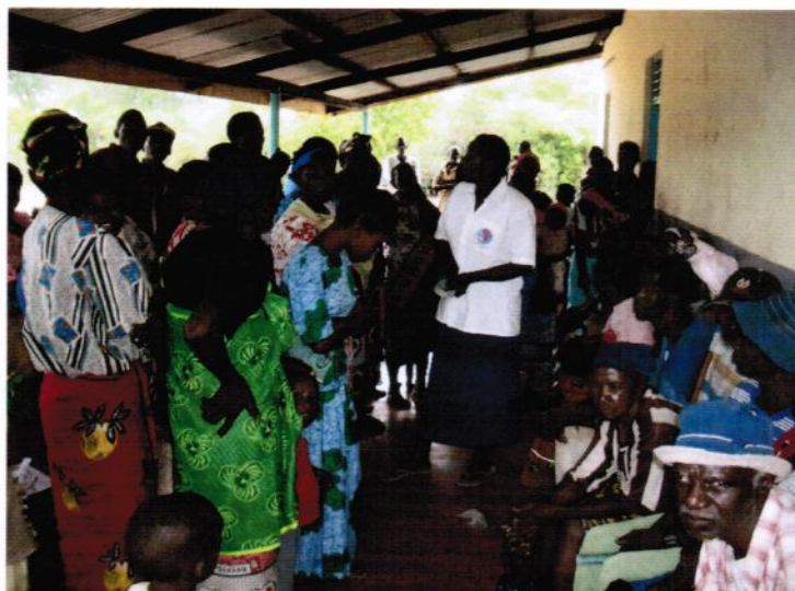
Das „Wartezimmer“ in Gongoni/Kenia.